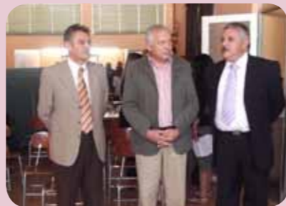
El alcalde Cáceres junto al director del SST, visitaron las dependencias del Cesfam Penco donde se levantará esta Uapo.

Una gran noticia recibió la comunidad de Penco al conocer la instalación de una Unidad de Atención Primaria Oftalmológica (Uapo) en la comuna. Se trata de un dispositivo en el nivel primario de atención que resolverá las patologías oftalmológicas que requieran recursos de menor complejidad. Esta es la cuarta Uapo que se incorpora a la red del Servicio de Salud Talcahuano, disponiendo de este unidad en Talcahuano, Hualpén, Tomé, y ahora en Penco.