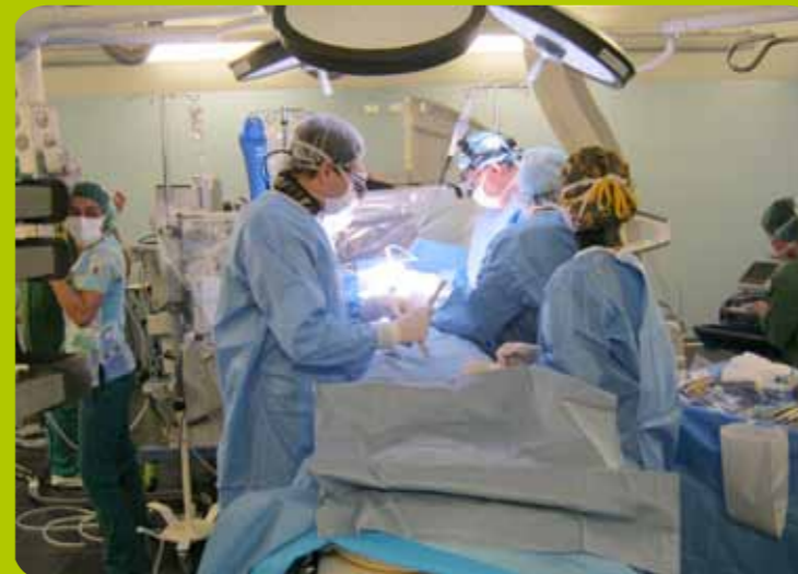
Este año se inauguró en Las Higueras, el primer pabellón de cirugías híbridas del país

Al finalizar este año, puedo decir que entre los avances más