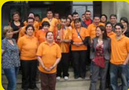
Los orgullosos campeones del 2011, del Centro Luz de Luna.