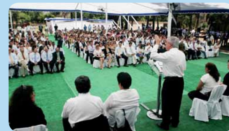
El Ministro Mañalich valoró los avances del sector en el 2011.

Por último, y respecto de los futuros desafíos que están planteados en la Estrategia Nacional de Salud, el ministro aseguró que el gran objetivo es "como logramos que la gente que está hoy sana, especialmente los jóvenes se mantengan sanas".