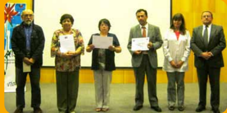
Algunos de los participantes premiados en el acto de conmemoración.

Su sexto año de vida cumplió el Programa Prais en el Hospital Las Higueras de Talcahuano, el que está orientado a la reparación biopsicosocial que requieren las personas afectadas por la depresión política ejercida por el Estado en el periodo comprendido entre septiembre de 1973 y marzo de 1990.