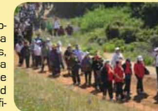
La caminata tuvo una amplia convocatoria

Alrededor de trescientas personas, participaron de una caminata recreativa por el Parque de Tumbes, de Los Cerros, en Talcahuano, con la finalidad de propiciar la adopción de estilos de vida saludable. La actividad se enmarcó dentro del programa oficial de la celebración del aniversario 247 de la ciudad y consignó la participación de adultos mayores, jóvenes y niños, quienes alegremente recorrieron el circuito de 2,5 kilómetros. En el trayecto, recibieron diversas charlas educativas de parte de alumnos de las Universidades San Sebastián y de Concepción, y también pudieron disfrutar de entretenidos deportes de cuerda, como canopy y escalamiento.