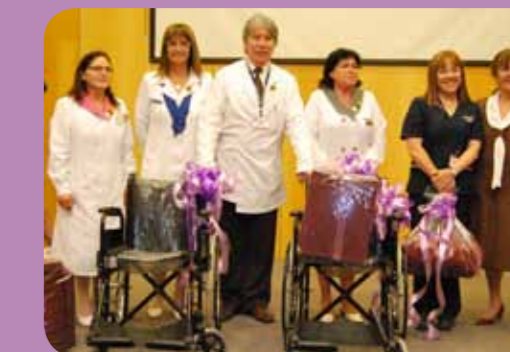
En la oportunidad la comunidad se hizo presente con obsequios para la Unidad de Diálisis y la Central de Sillas de Ruedas y Camillas.

del Programa de Hospitalización Domiciliaria, la "marca cero" en las Garantías Ges de Oportunidad y el Sistema Informático de la Red Asistencial conocido como Sidra, ya que son ejemplos de los avances de la institución.