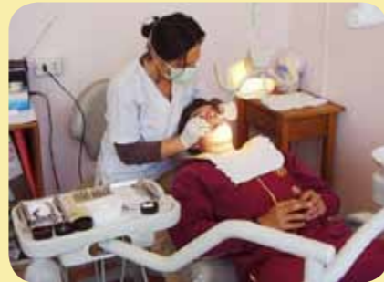
Atención dental en Tomé