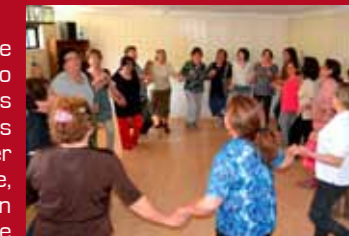
El taller de Biodanza ha sido ampliamente valorado por las usuarias.

El taller se trabaja en dos módulos semanales, martes y jueves, desde las 15.00 horas y las usuarias deben ser derivadas desde su Cesfam. La Biodanza se realiza de manera complementaria a las acciones terapéuticas llevadas a cabo en los distintos establecimientos de salud de la comuna, por lo que los profesionales a cargo procuran velar por que no abandonen su tratamiento.