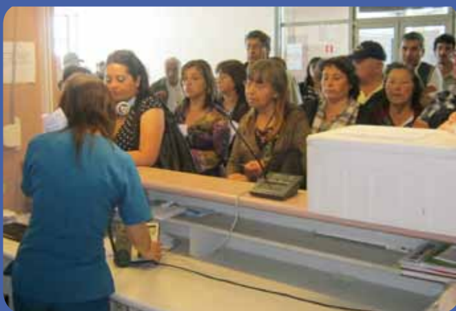
Bajar la presión y la espera en Farmacia es el objetivo de lo realizado

El facultativo concluyó que gran parte del éxito de estas acciones dependen del apoyo de los mismos usuarios a quienes se les reitera la solicitud de concurrir a Farmacia en los horarios que se le indican y no en otros.