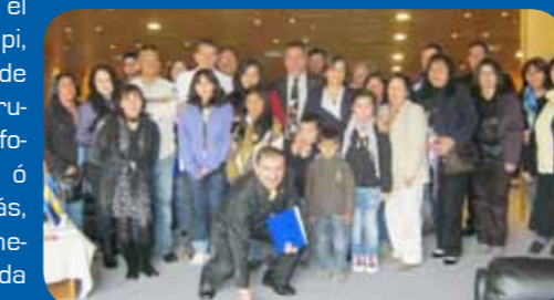
Los asistentes a la jornada valoraron la preocupación por quienes han abandonado sus tratamientos de labio leporino y fisura palatina.

Finalmente el presidente de Apafi, señaló que se pudo contactar a la agrupación en los teléfonos 9.2830014 ó 2412200, además, se reúnen los primeros sábados de cada mes, a las 16.30 hrs, en los containers del hospital.