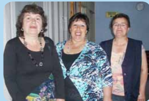
Parte de la nueva directiva del Consejo de Desarrollo del Hospital de Penco.